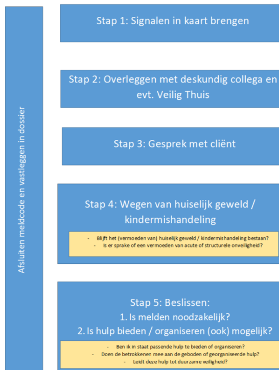
Figuur: Meldcode kindermishandeling en huiselijk geweld

Stap 2: de deskundige collega's zijn de leden van het CvB.